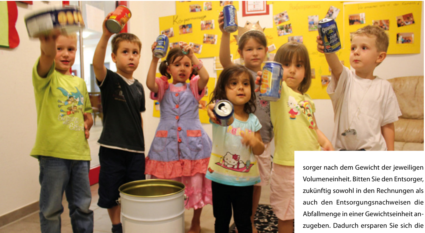
▲ Kinder lernen frühzeitig, dass Stahlverpackung kein Abfall, sondern ein Wertstoff ist

sorger nach dem Gewicht der jeweiligen Volumeneinheit. Bitten Sie den Entsorger, zukünftig sowohl in den Rechnungen als auch den Entsorgungsnachweisen die Abfallmenge in einer Gewichtseinheit anzugeben. Dadurch ersparen Sie sich die Umrechnung. Auch die Dokumentation der Rohstoff- und Entsorgungskosten erleichtert die spätere Prioritätensetzung. Denn die Vermeidung von Abfall, der wie z. B. Lösemittel teuer eingekauft und als Abfall gleichfalls teuer entsorgt wird, spart nicht nur Ressourcen, sondern auch viel Geld.